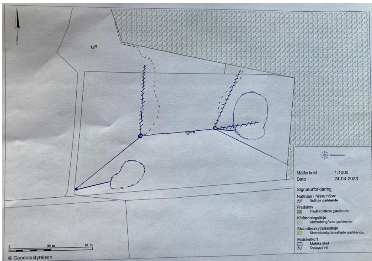
Figur 2: Viser de tiltag, der ansøges om. Blå streger med krydser over er drænledninger, der ønskes sløjfet. Blå stiplede streger er nye åbne vandløbsstrækninger. Blå streger er eksisterende drænledning, som udskiftes til lukkede rør. 2 brønde er markeret på kortet med blå cirkler. Derudover ses placeringen af de 2 vandhuller, der har fået særskilt landzonetilladelse i 2021.