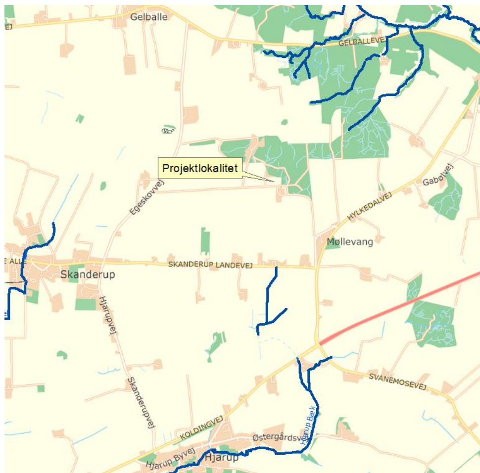
Figur 1: Oversigtskort.

Lokaliteten er markeret på oversigtskortet herunder. En detaljeret beskrivelse af projektet fremgår af ansøgningsmaterialet, som er vedlagt dette høringsbrev.